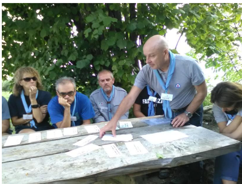
Uscita di Zona Masci - S.Giorgio in Ceparano settembre 2018